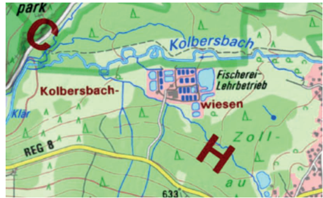
Abb. 4 - Topographische Karte