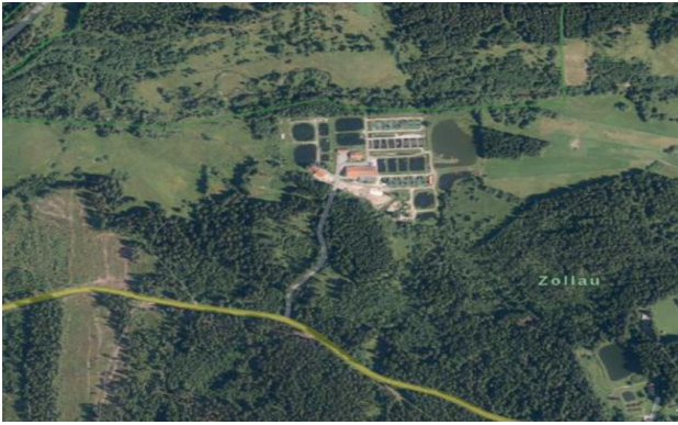
Abb. 3 - Luftbild / Orthophoto